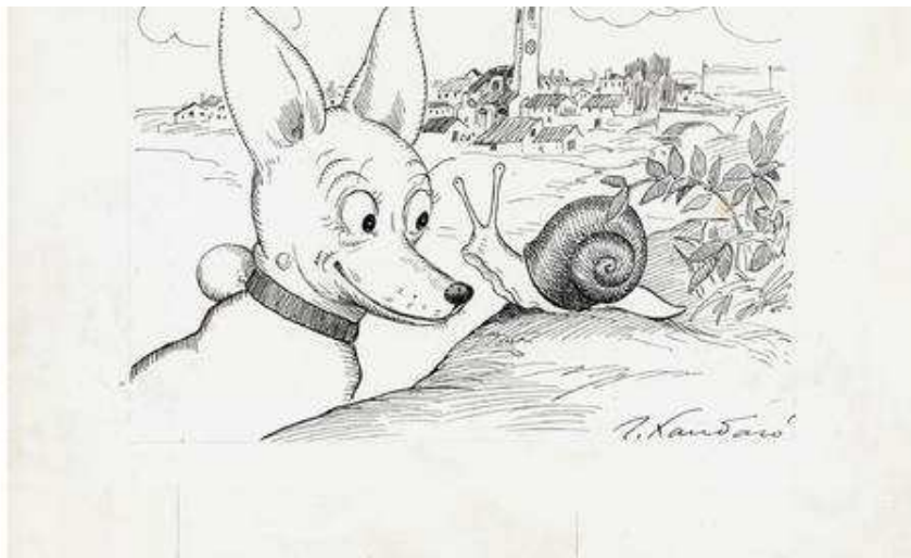
'Primeras tentativas': retrospectiva en España sobre Marc Pataut