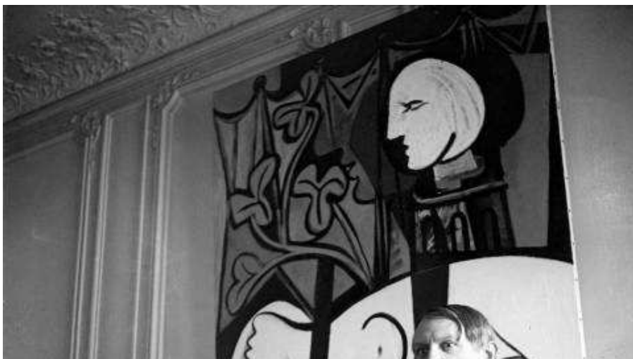
10 exposiciones para disfrutar del puente de Mayo en Madrid