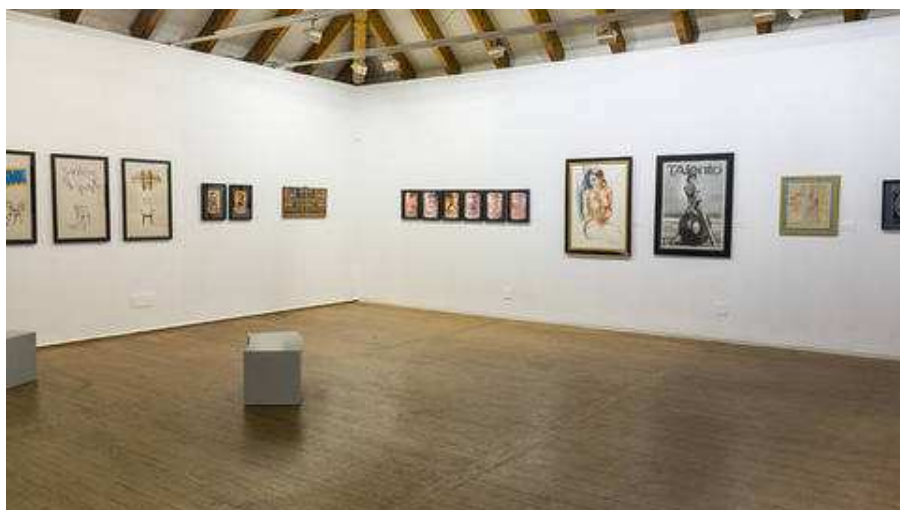
'Greguerías Ilustradas': De la Serna esboza su mordacidad