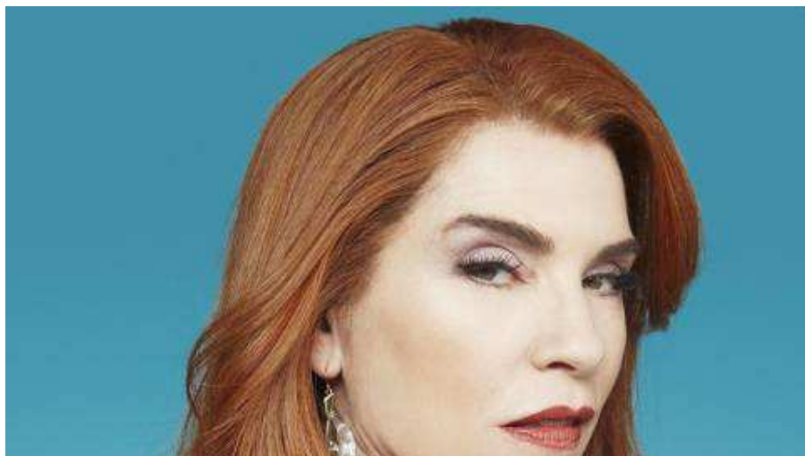
• 'Dietland': humor negro para las mujeres de hoy en día