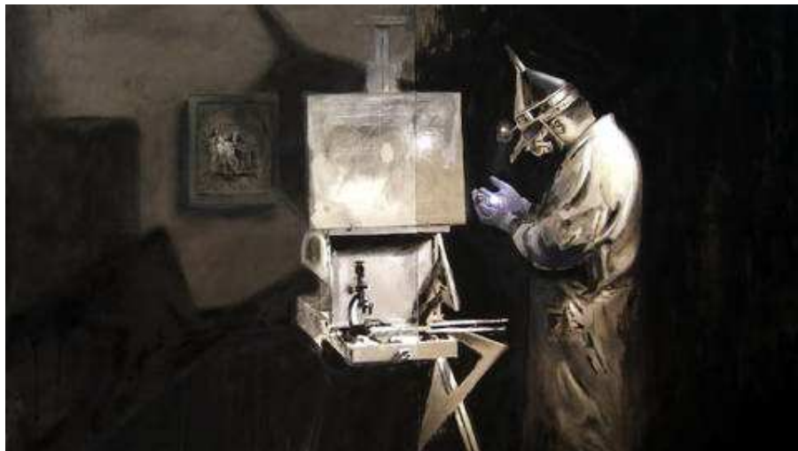
'Fenómenos infraveles': la búsqueda de lo efímero de Alberto Palomera