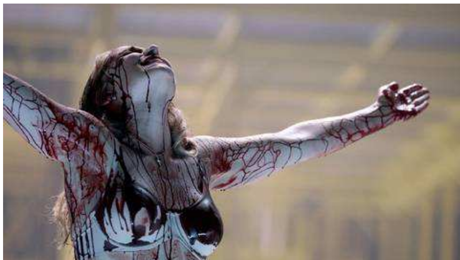
La monstruosa 'Die Soldaten' lleva el horror de la violación al Teatro Real