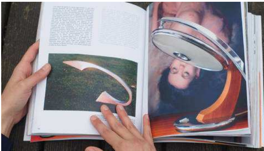
Los poemas sin palabras de Tina Hernández y su cubismo vibrante